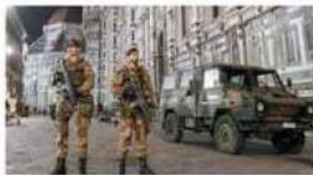
Militari nei pressi del duomo di Firenze