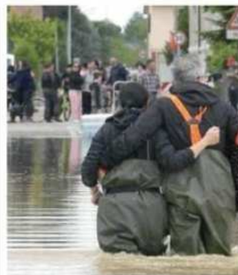
Una immagine dell'alluvione che ha colpito l'Emilia Romagna nel giugno del 2023 provocando danni intorno ai 9 miliardi

29 decessi e 23 Comuni, Abruzzo con 24 decessi e 12 Comuni. Un alto numero di Comuni a rischio viene identificato anche in Emilia-Romagna (12), Calabria (10) e Liguria (10). Tra le regioni ad alto rischio c'è anche la Valle d'Aosta con 8 decessi, un numero elevato se si tiene conto degli abitanti complessivi. Circa il 50% dei 247 Comuni italiani con almeno un decesso è costituito da centri montani o poco abitati, dove il rischio di mortalità as-